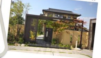
街の景観の要素 道路に面した部分: その建物の顔 門 塀 フェンス 植物 表札 建物の外装