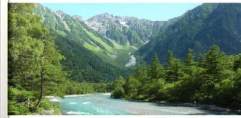
自然景観: 緑、地形、水、植物、生物