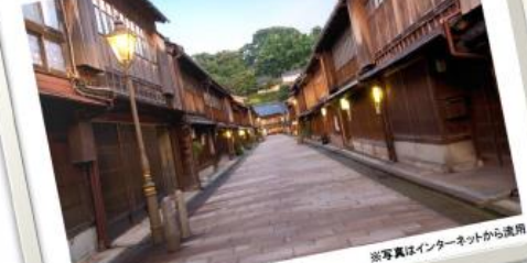
人文景観: 人によってつくられたもの